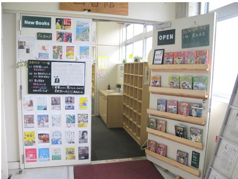
5月前半は、「コナン×歴史本」を展示していました。よく借りられ、本が少なくなったので、途中で展示更新。