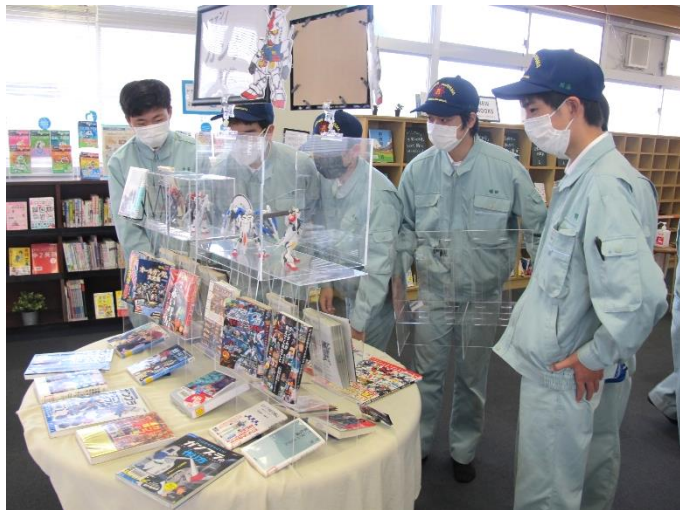
↑ R科の課題研究でアクリル書架を制作してくれている生徒たち。続々と様々な形のアクリル書架を制作してくれて、ありがとうございます！