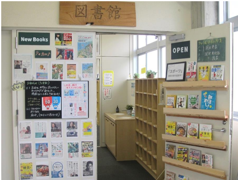
扉面では、新刊情報を随時更新中。

緊急事態宣言が出され、部活動もこれまでと同じようにはできない現在。しかし、中でも「筋トレ」「体づくり」などは、自宅でもできるはず。スポーツ新刊本を追加中。