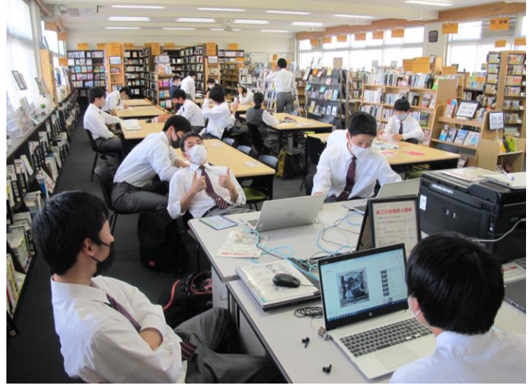
とっても元気な、活気ある時間が流れる日もあり。