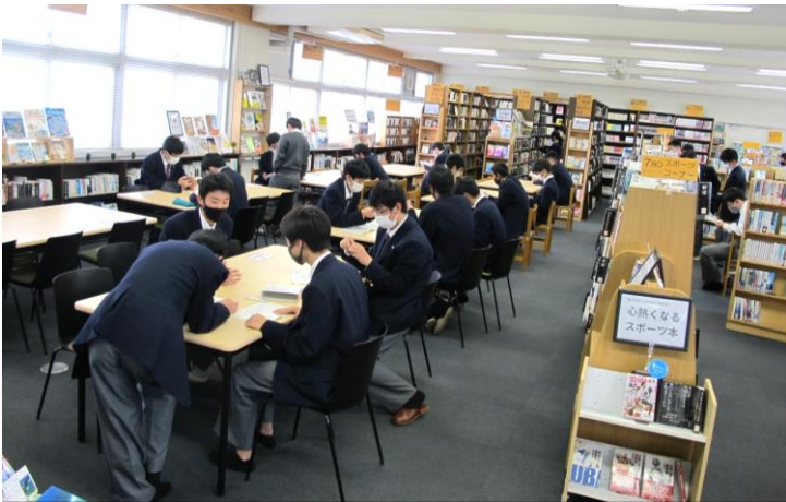
こんな時期だからこそ、ちょっとでも息抜きになれば。