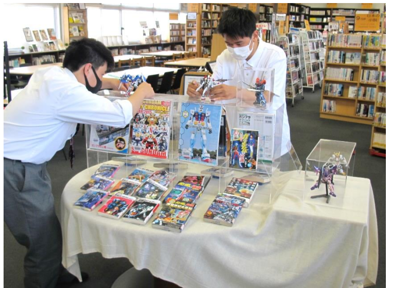
↑ 朝イチでコーナーを拡張する図書委員たち。本と「ガンプラ」の見せ方を工夫しているところです。それにしても、朝からすごい集中力です！