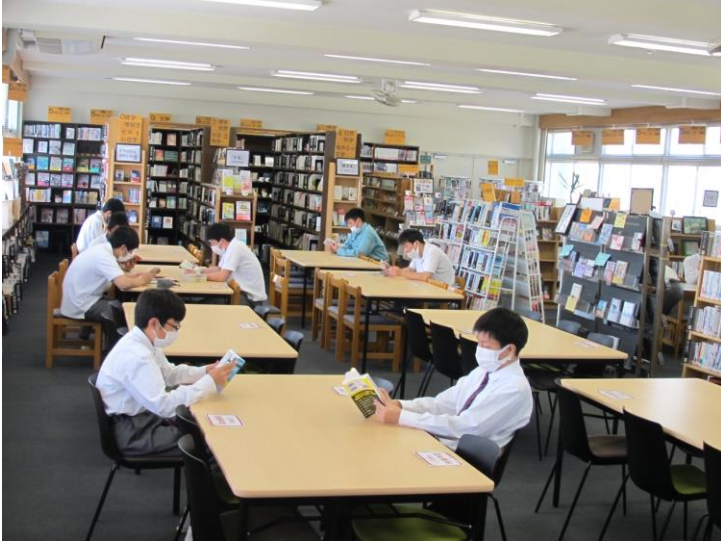
静かな時間が流れる日もあれば・・・