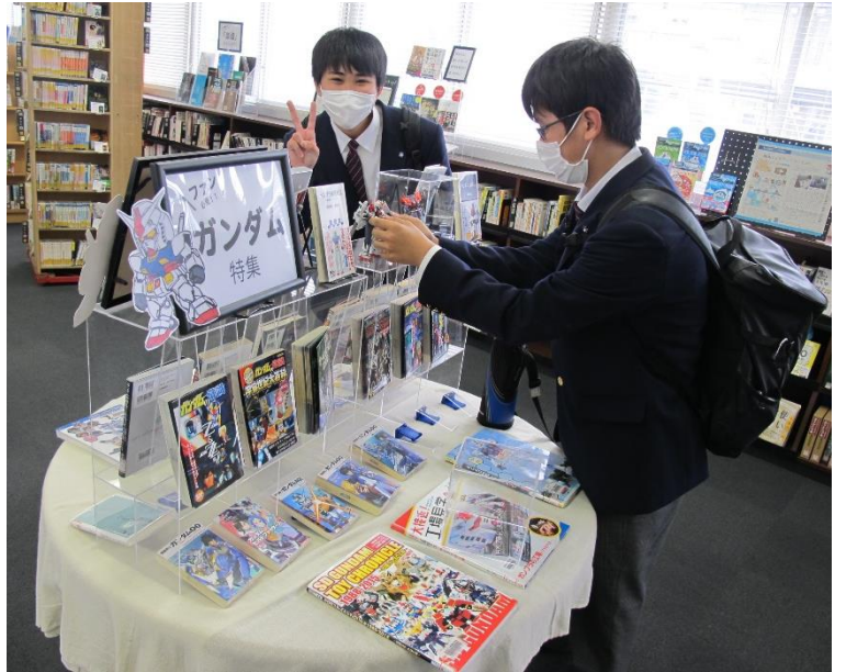
↑ ポージングチェックにくる図書委員。

先月、生徒からのリクエストで始めた「ガンダム特集」。その後、図書委員の生徒たちが「ガンプラ」を制作したものを追加し、本も入れ替えながら、展示を拡大更新中。「ガンプラ」の実物が加わったことで、さらに注目度が上がりました。壊れないようにするために、R科の先生が「ガンプラ」専用の展示ケースまで制作してくださり、一気に展示がしやすくなりましたし、安心して展示を見てもらえています。