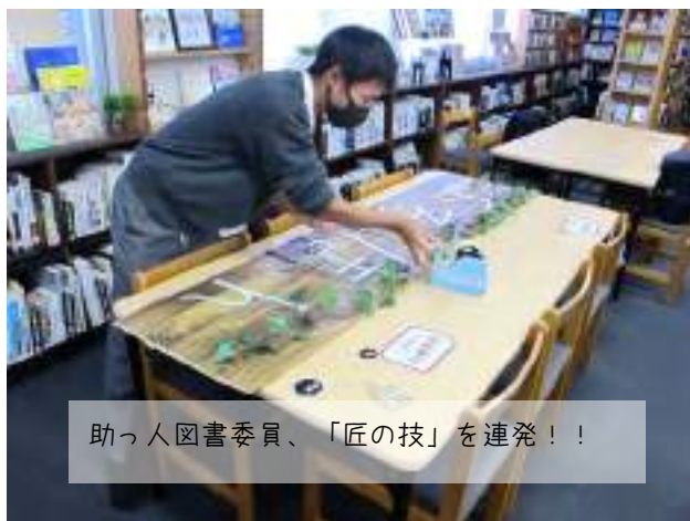
助っ人図書委員、「匠の技」を連発！！