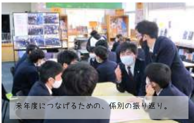
来年度につなげるための、係別の振り返り。