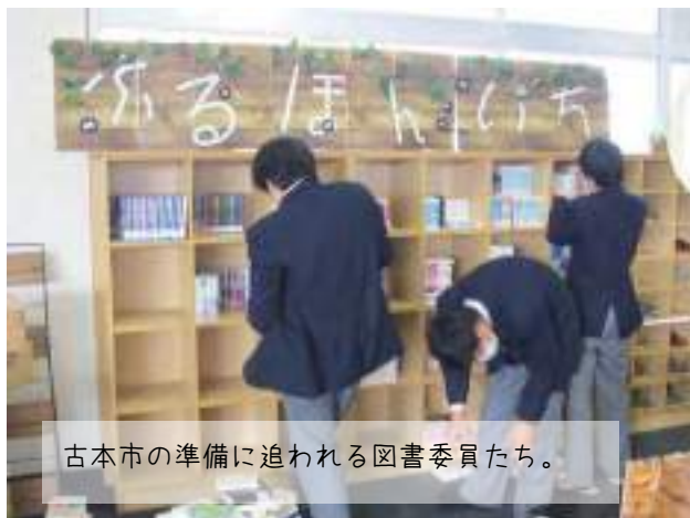
古本市の準備に追われる図書委員たち。