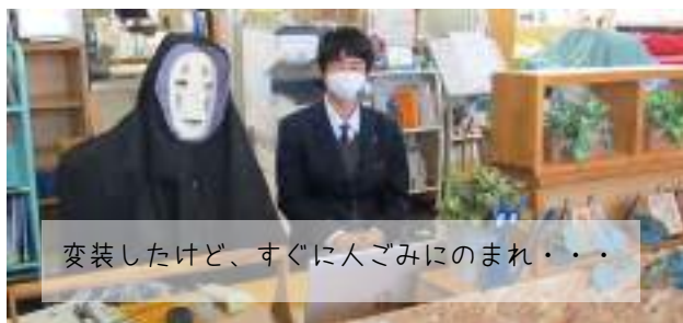
変装したけど、すぐに人ごみにのまれ・・・