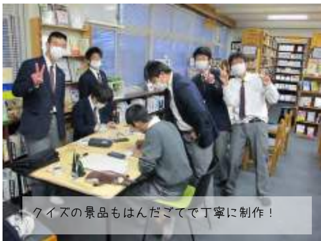
クイズの景品もはんだごてで丁寧制作！