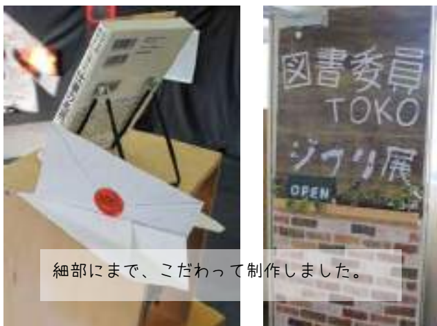
細部にまで、こだわって制作しました。