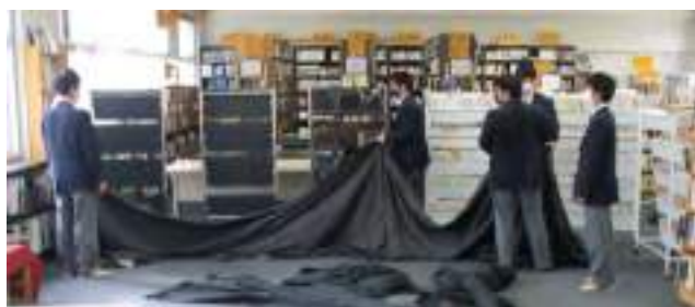
図書館をどう利用すると効果的か、動線を意識しながらレイアウトを検討していました。

今年度の図書委員は、自分たちで何度も話し合ったり、自発的に試作品を作ってきたりと、積極的に取り組む姿勢が印象的でした。自分たちが決めた期限までにほとんどの作業を仕上げ、文化祭終了後には、自発的に「振り返りの会を開きたい」と提案してきて、皆で集合するなど、生徒主体で考えて動く立派な活動でした。委員同士の結束力も見事なものでした！