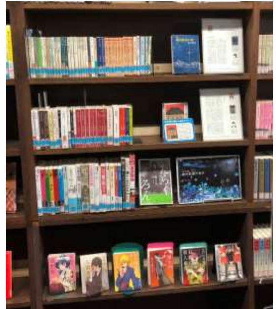
↑ 名作文学コーナーで有名作品を pickup。