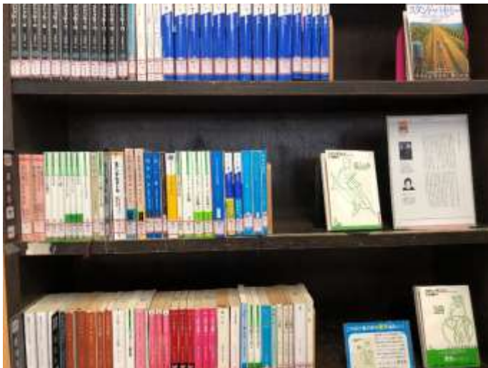
↑ 意外と読みやすい本もある海外文学コーナー。