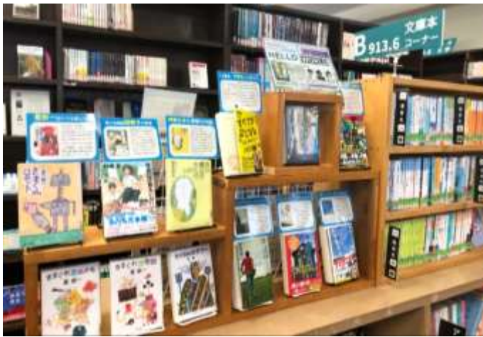
↑ 一般文芸の文庫本コーナーで人気作をPOP紹介。