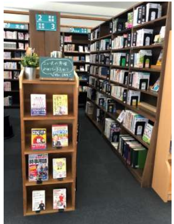
↑ 3類（社会科学）の脇で時事問題本を展示中。