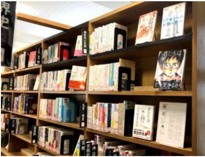
↑ 1類（哲学・心理学）の書架で人気の人生論。

1学期から継続的に書架整理を行っており、ひと段落ついた分類の書架では、本をいくつかピックアップしてミニ展示を行っています。背表紙ばかりがぎゅうぎゅうに並んでいても利用されにくい状況ですので、なるべく表紙が見えるような書架づくりを行っています。様々な本と出会っていただけたらと考えています。