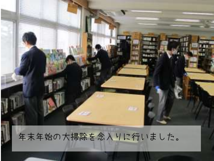
年末年始の大掃除を念入りに行いました。