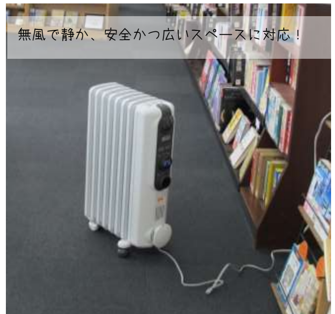
無風で静か、安全かつ広いスペースに対応！

念願の足踏み式消毒が届き、消毒設置を増加。さらに、建物の構造上寒さが厳しい図書館にオイルヒーターが届き、しっかり換気しながらも暖房が行き渡るように整備していただきました。