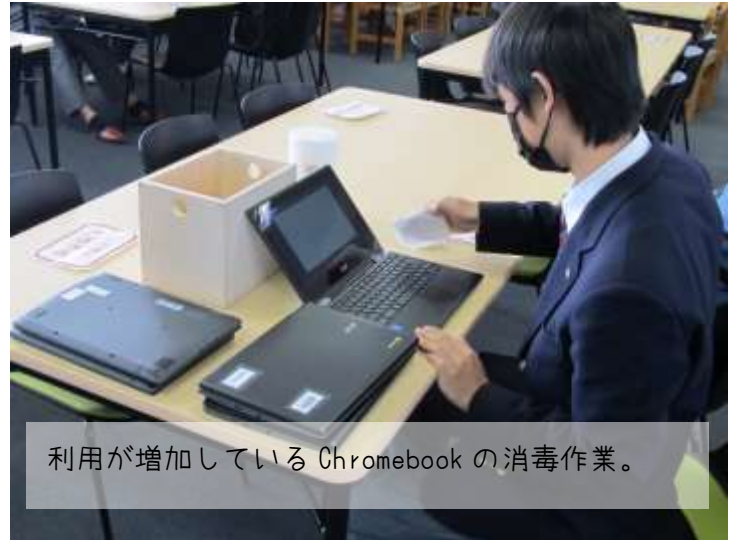
利用が増加している Chromebook の消毒作業。