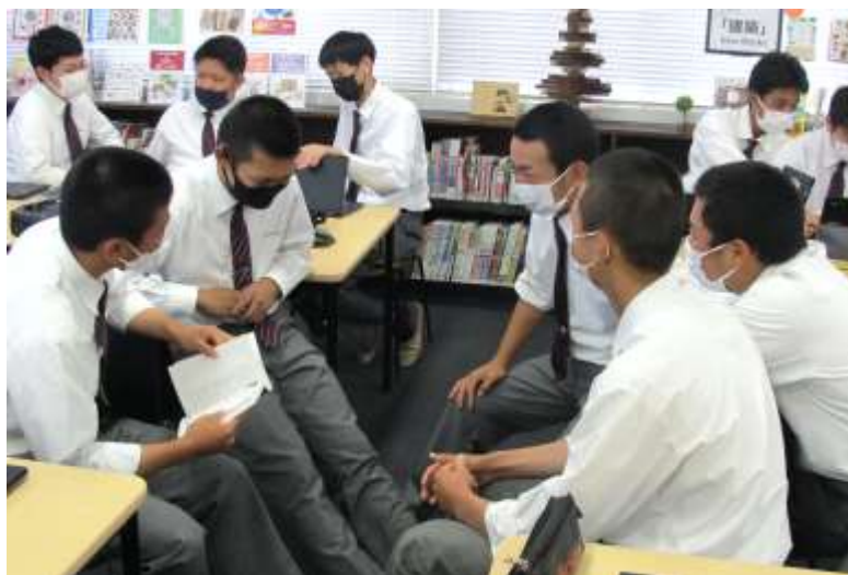
業間休みには、本を囲んで、楽しいひと時を。