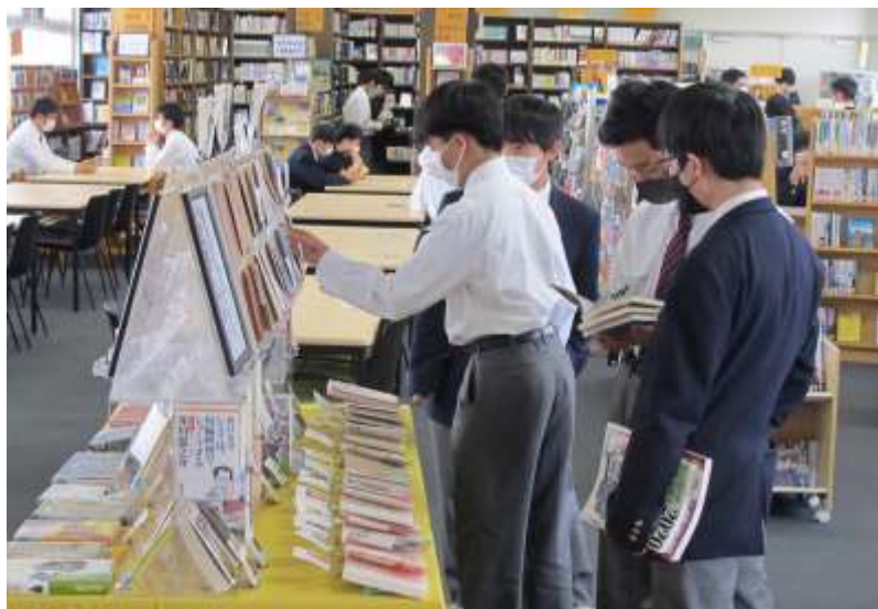
昼休みは、友人と本を探しに来たり、情報交換をしたり。

5月は、連休明けから、みなさんの利用が増えてきました。特に昼休みは多く、貸出の列ができる日もありました。図書委員のカウンター当番もだいぶ慣れてきて、忙しい作業に嬉しい悲鳴をあげています。