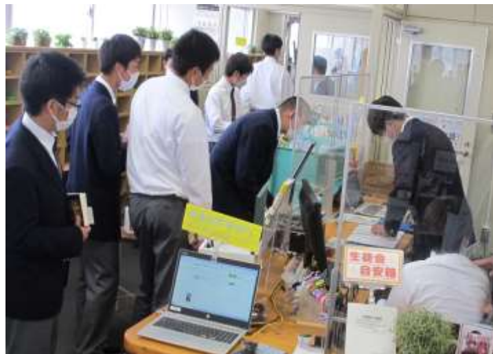
カウンターでの貸出風景も盛況です。