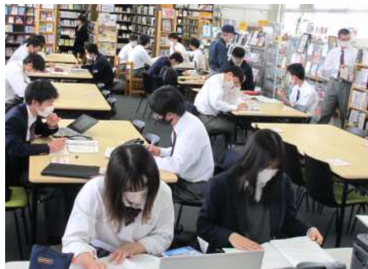
テスト週間の放課後風景。Chromebookを使う生徒も。