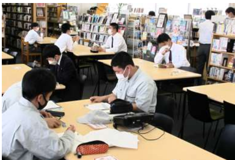
閲覧席で課題をこなしたり、読書をしたり。

また、中間テストが近づいてくると、放課後の図書館にはテスト勉強やレポート課題に取り組む人の姿が多くなり、シーンと静かな空間に鉛筆をカリカリと動かす小気味よい音が響いていました。