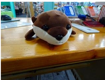
いつの間にか撮影されていました。