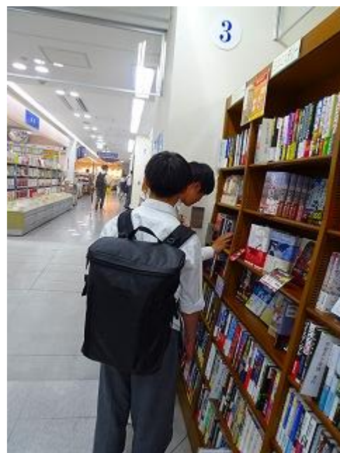
友だちとの参加した生徒もいて、みんなで和気あいあいと本を選びました。初めての1年生も参加してくれて、道中はぐれないか3年生が面倒を見る姿が、とても微笑ましかったです。