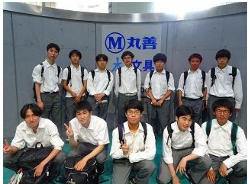
定期考査最終日に、丸善岡山シンフォニービル店まで本の買い出しに行ってきました。