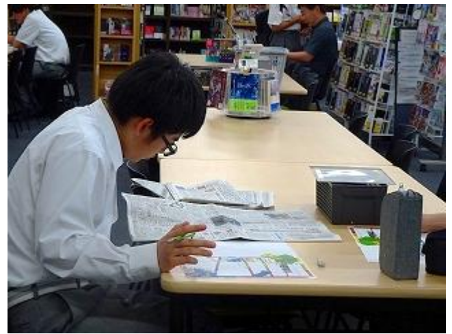
委員会活動の様子。黙々と作業中です。