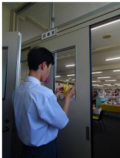
季節の展示。今は「梅雨」がテーマです。