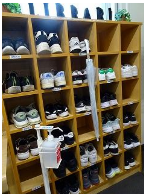
テスト期間前の靴箱。この日は靴箱が埋まったため、ダンボールをひいて、しのぎました。