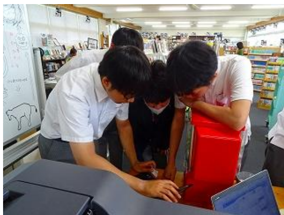
図書委員企画「音楽ガチャ」に群がる生徒たち。